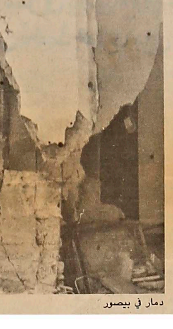
دمار في بيبصور