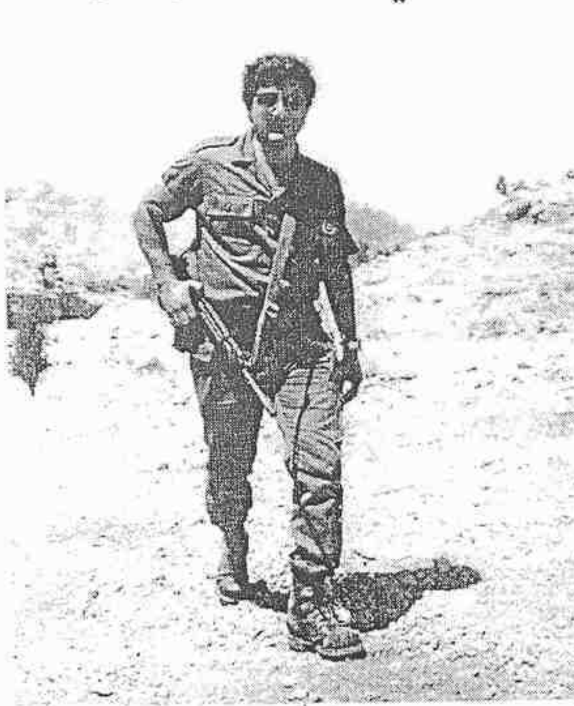
شفتري الجليلي في سلاحه الأول