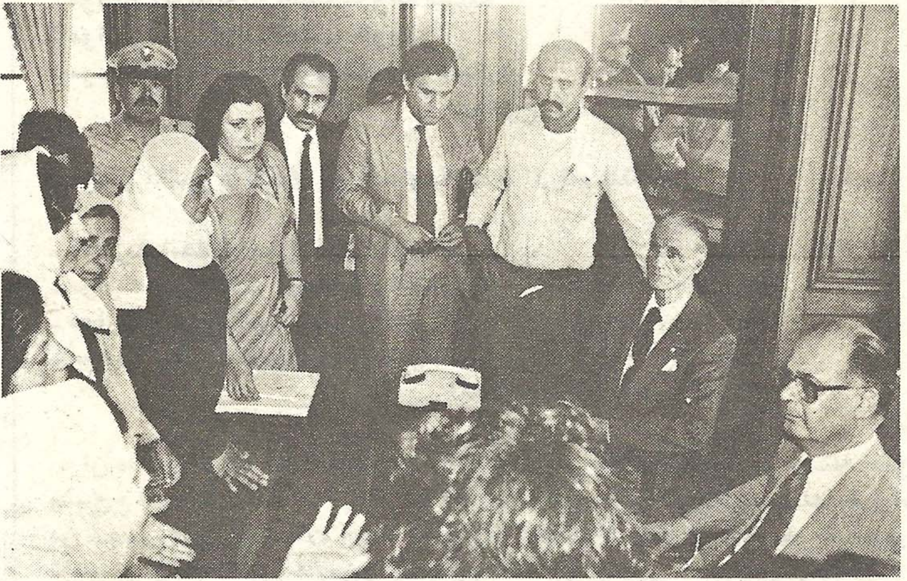
الحص والجميل خلال لقائهما الوفد المشترك . ( علي حسن )

كما التقى الوفد رئيس حزب الكتائب بيار الجميل ، الذي قال : اننا نهتم بالقضية ولم ننسها ، لانها قضيتنا . ومجرم كل واحد يخطف ، ومجرم من لا يعمل من اجل هذه القضية ، وانا مستعد ان افعل المستحيل .