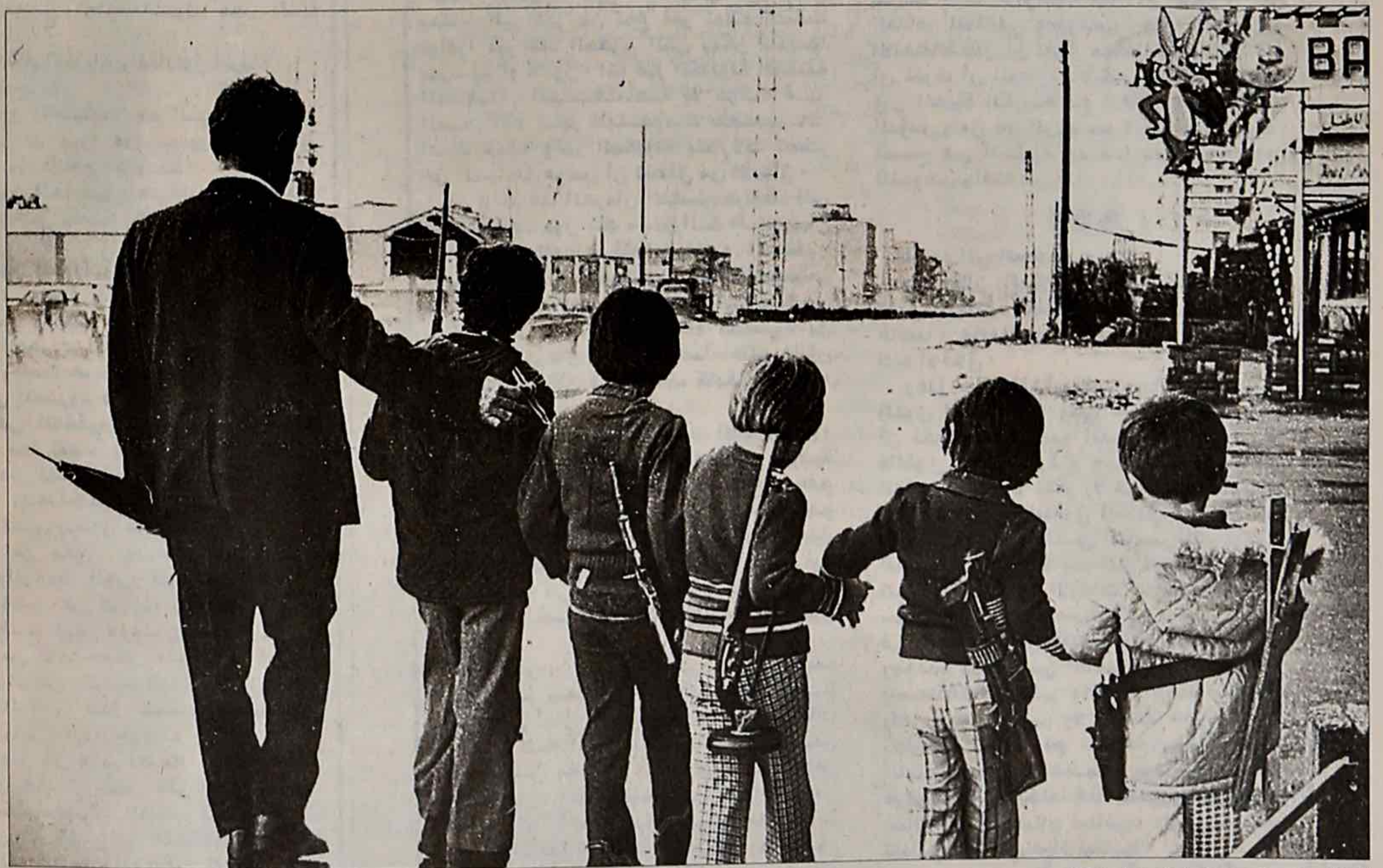
الاطفال ولعب الحرب على اوتستراد انطلياس.