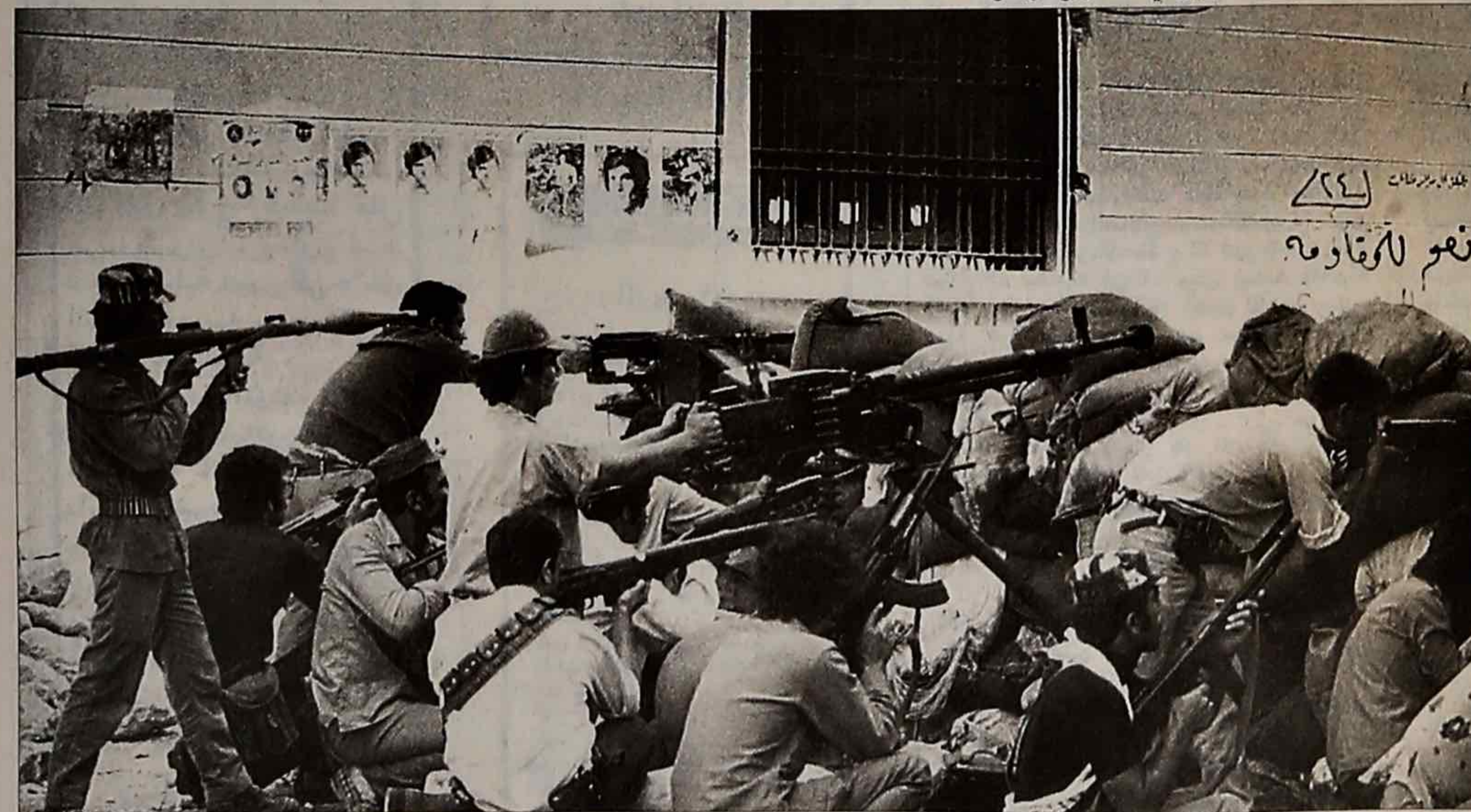
مجموعة من "القوات المشتركة" وراء متراس من جمة القبة في طرابلس.