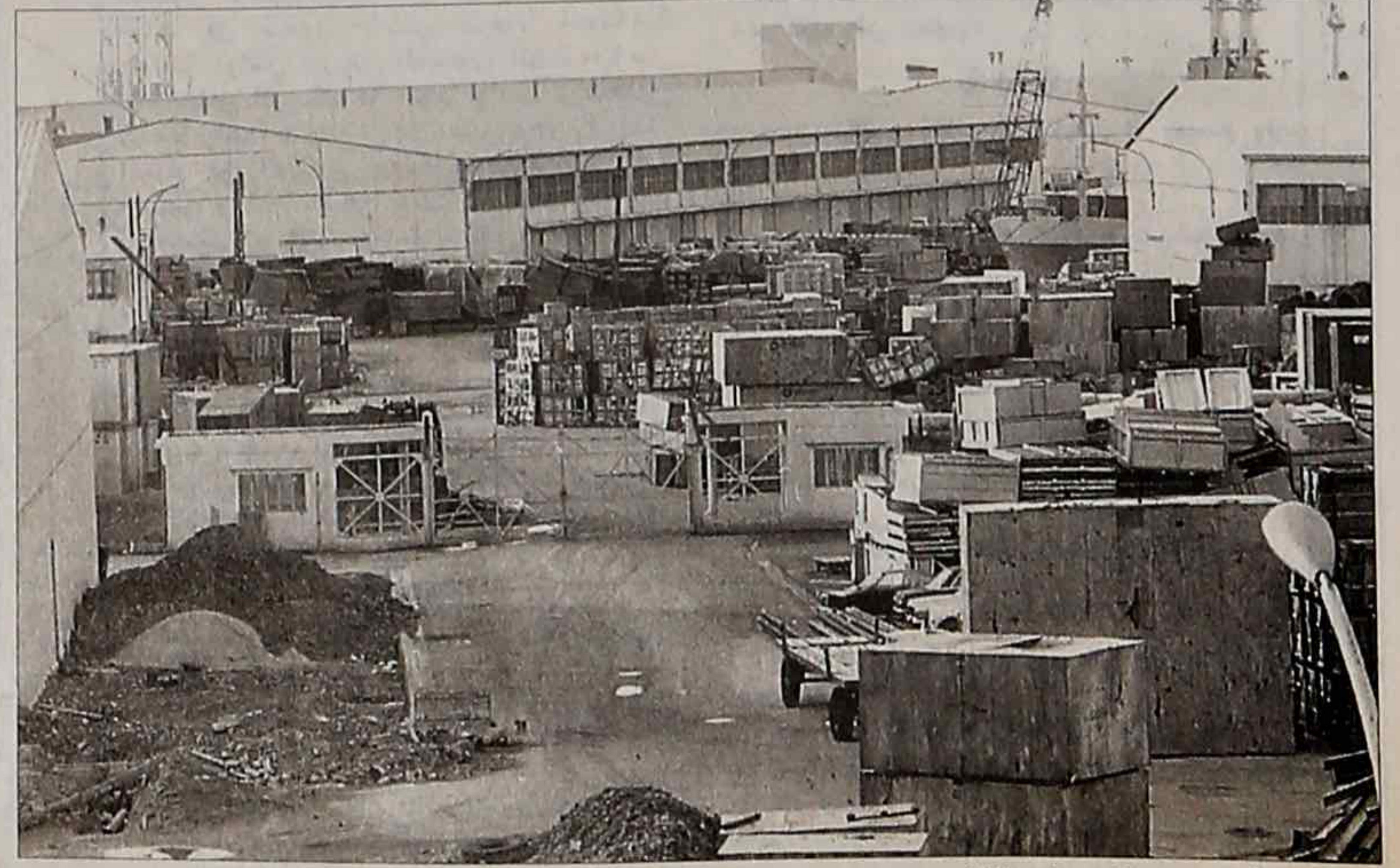
ضلال في مرفأ بيروت في ١٩ نيسان ١٩٧٥.