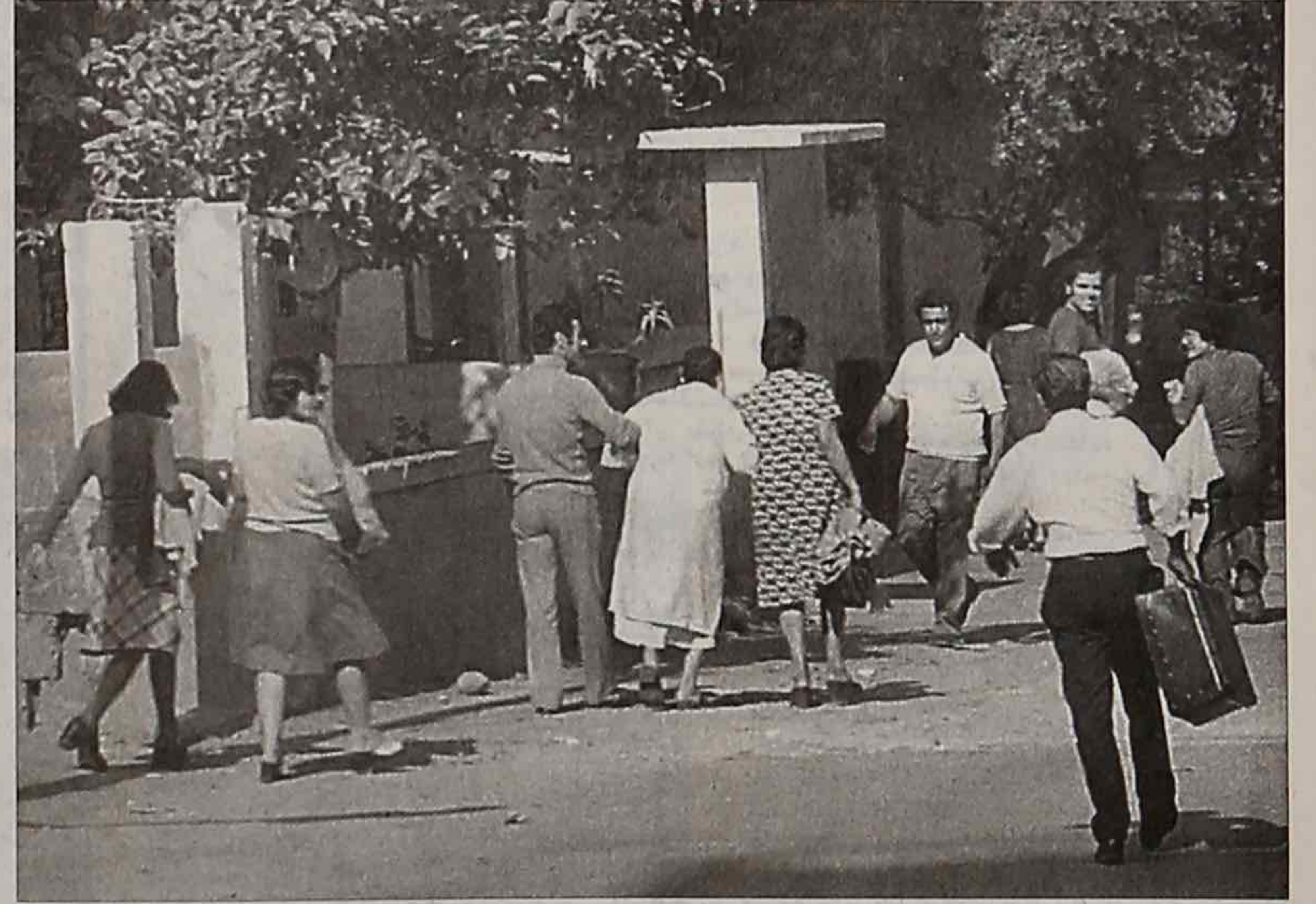
من مشاهد النزوح في ايار ١٩٧٥.

بعد حادثي الكنيسة والبوسطة في عين الرمانة انفتحت ابواب الجحيم اللبناني. اصوات الانفجارات صمّت الاذان ودخان الحرائق اندفع بعيداً في السماء ايذاناً بان الحرب قد بدأت. وصار السلاح غير الشرعي مرئياً وصار الامن الرسمي شبحاً يتراءى خياله ويتوارى. الضحايا يتساقطون، ومعظم اللبنانيين وهم احياء ضحايا الامن الفالنت ولقمة العيش التي صار الحصول عليها نضالاً لا يشق له غبار.