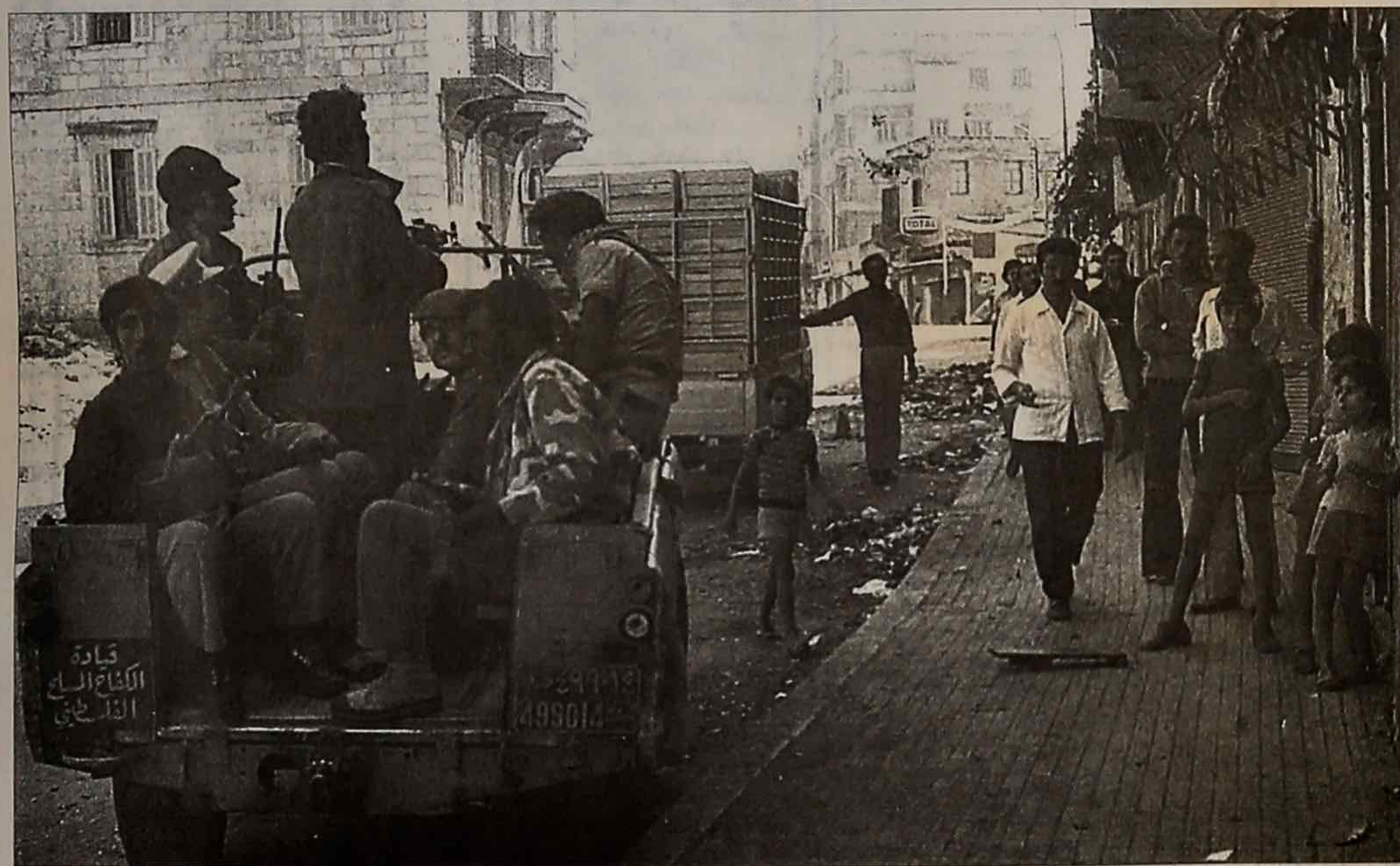
عناصر من "الكفاح المسلح" الفلسطينيين في أحد شوارع طرابلس.