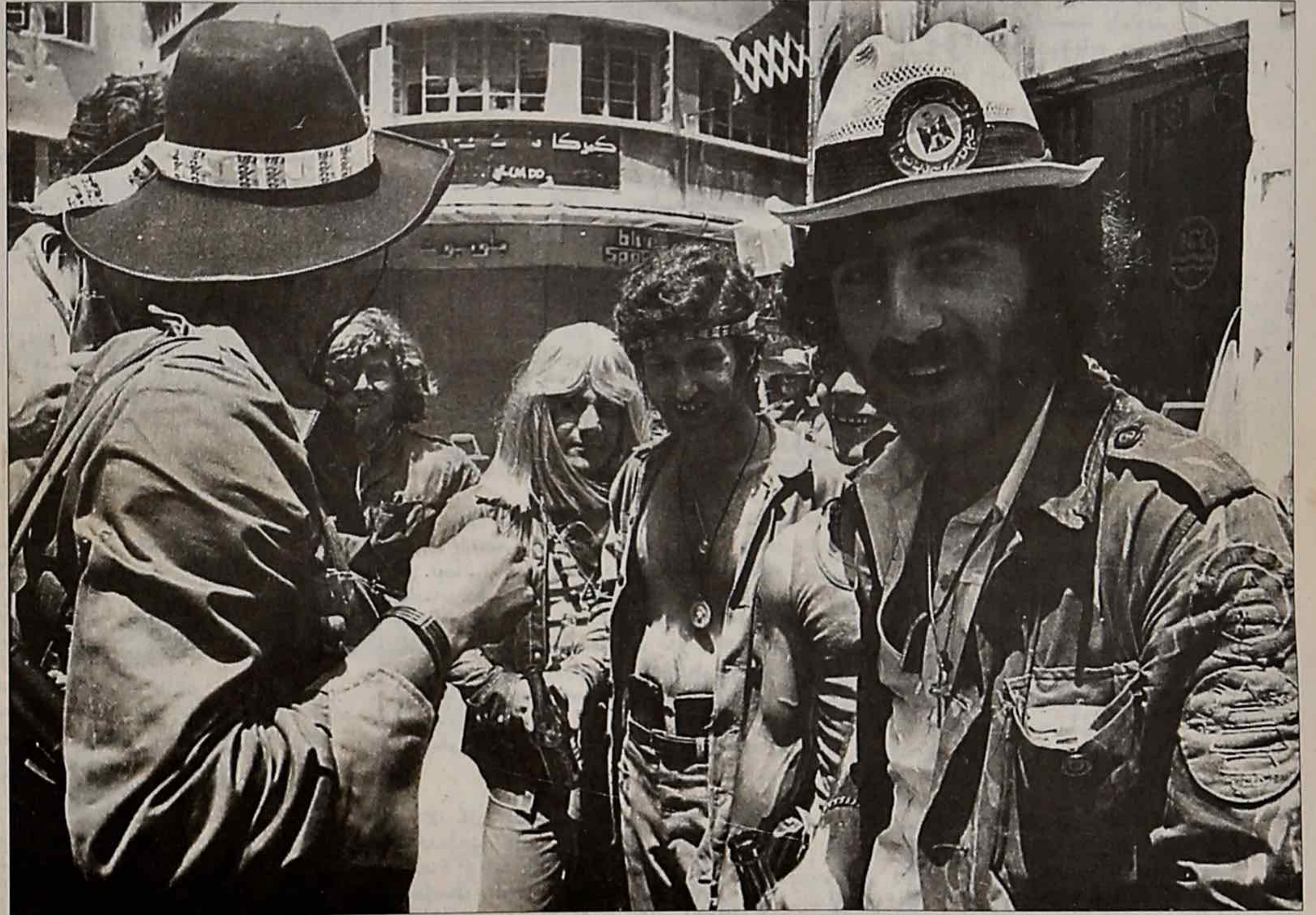
عناصر كتائبية واعتمر احدهم (من اليمين) قبعة تحمل شعار "قوات ناصر".