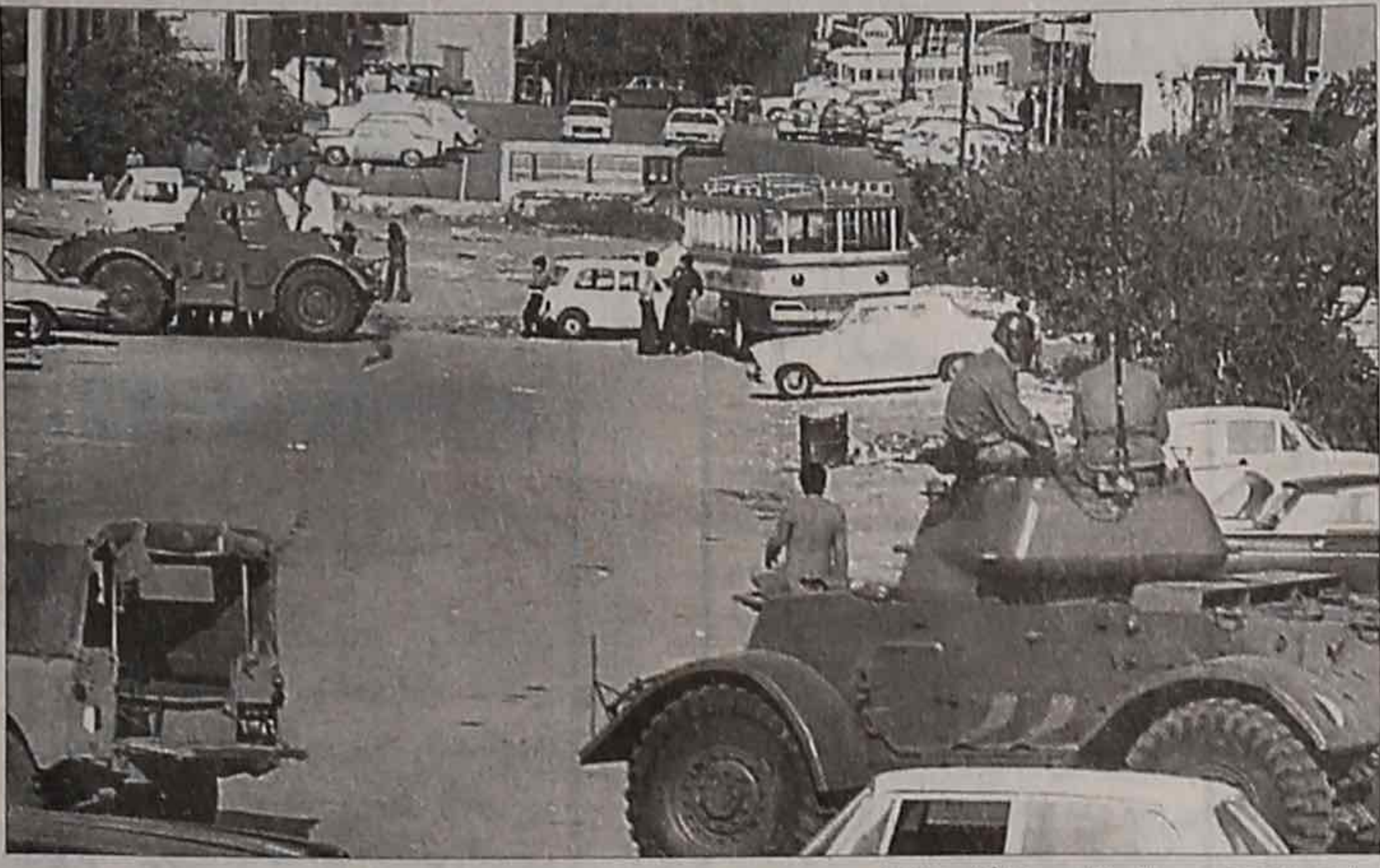
اجراءات امنية في عين الرمانة يوم ٢ ايار ١٩٧٥.